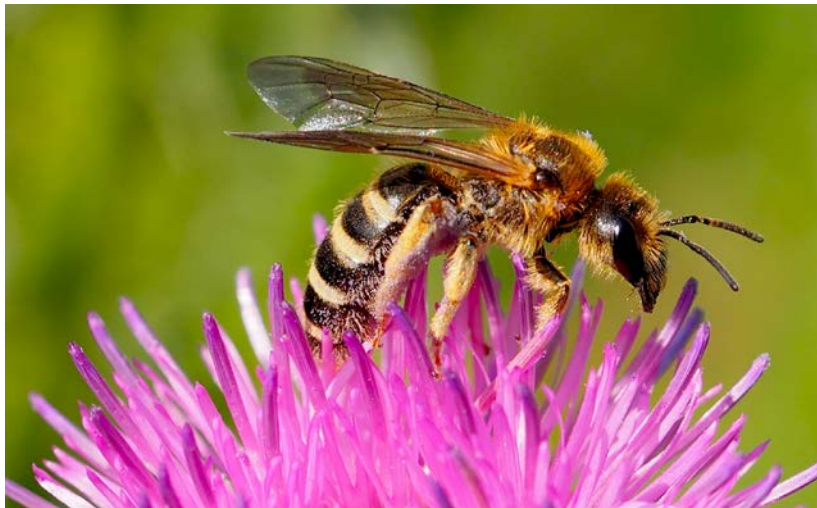
Gelbbindige Furchenbiene auf Scabiose ( Halictus scabiosae )

Bundesprogramm Biologische Vielfalt Förderschwerpunkt Ökosystemleistungen FKZ: 3516 685A-B02