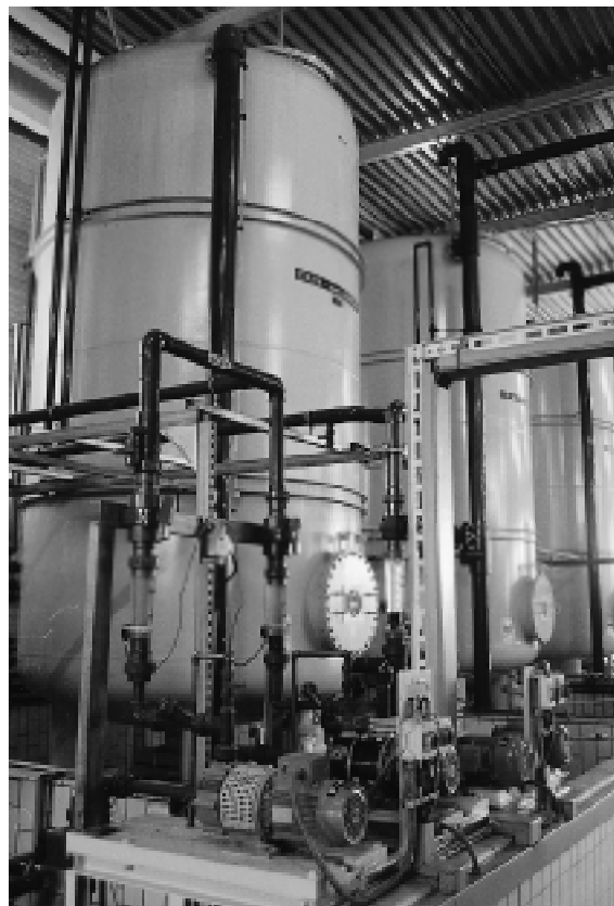
Bild 2: Blick auf die zu prüfenden Apparaturen und Behälter.

weltgefährdende Chlorkohlenwasserstoffe freisetzte. Ein bestimmter Grenzwert darf hier nicht überschritten werden. Ingenieur Habenicht nahm entsprechende Messungen vor und un-