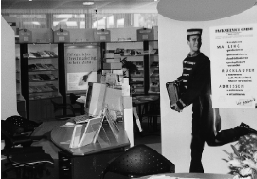
Bild 2: Ein Blick in die Fach-Bibliothek im Direkt-Marketing Center Wiesbaden, die über 100 Titel rund um dieses Thema enthält.

Die Themen reichen von Neukundengewinnung über Textgestaltung bis zu Database-Marketing .