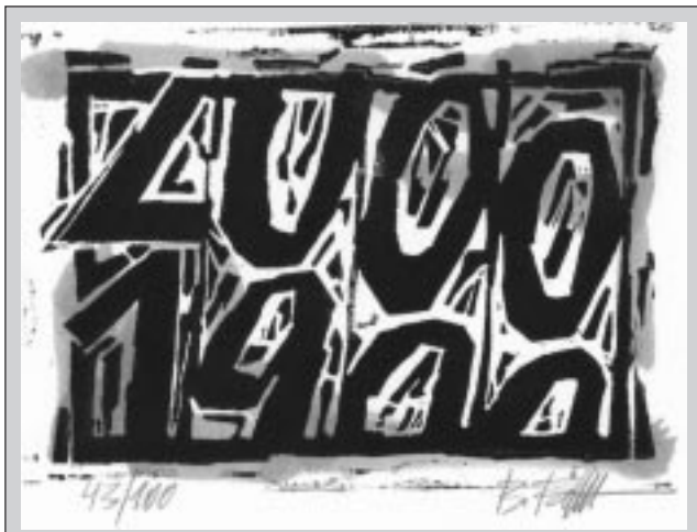
Kolorierter Linoldruck von Bernhard Förth. Handabzug auf Büttenkarton 10 x 14,5 cm

Nun ist es endlich soweit: Das Computer-Millennium ist erst einmal überstanden, obwohl das neue Jahrtausend in Wirklichkeit erst am 1. Januar 2001 beginnt.