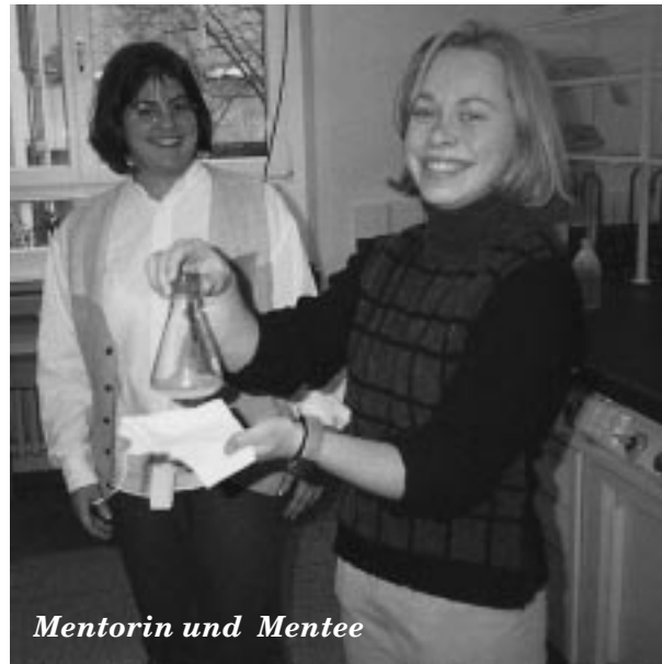
Freude über die Lyse des Bacillus Subtilis. Gymnasium Nieder-Olm, die 10. Klasse beim Projekttag am Institut für Biochemie, Universität Mainz.