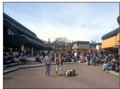
Campus der FH Wiesbaden am Kurt-Schumacher-Ring

In den ersten Jahren waren die Einrichtungen der Hochschule über Wiesbaden verstreut. Ab Mitte der 80er Jahre entstand dann der FH Bau am Kurt Schumacher Ring. Doch schon bald erwiesen sich auch diese Einrichtungen als zu klein, da immer mehr Studenten nach Wiesbaden drängten und einige neue Fachbereiche entstanden. Waren es im Sommer 1974 noch 1813 Studenten, die an der FH immatrikuliert waren, stieg