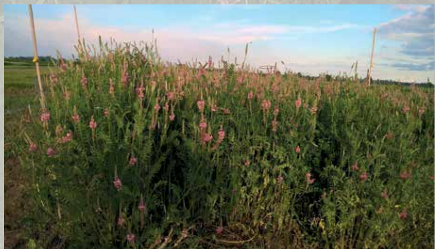
Esparsette in der Blüte.