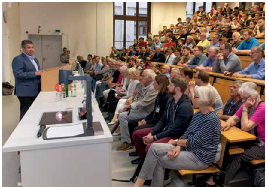
Publikumsmagnet: Sigmar Gabriel bei seinem Auftritt in Braunschweig.

„Die neue Seidenstraße ist keine sentimentale Erinnerung an Marco Polo“, sagte Sigmar Gabriel, „sie soll die Weltordnung verändern.“ China plant eine neue Handelsroute, indem es Infrastrukturprojekte in fast siebzig Ländern anstößt. Durch diesen Ausbau von Straßen und Schienen, Bahnhöfen, Flug- und Seehäfen, Pipelines, Kraftwerken und Datenleitungen werde die Volksrepublik einflussreicher und präsenter, sagte Gabriel, „vom südostasiatischen Raum bis tief hinein in die Europäische Union“. Nach Meinung des 58-Jährigen erleben wir einen „besonderen zeitgeschichtlichen Moment“: Zum ersten Mal seit Ende des Zweiten Weltkriegs versucht eine aufstrebende Weltmacht, ernsthaft gegen die westliche wirtschaftliche Dominanz anzugehen. Wenn China wie geplant bis zum Jahr 2049 für rund 900 Milliarden Dollar die Erde mit seinem Handelsnetz überzieht, wird nichts mehr so sein, wie es jetzt ist. „In dreißig Jahren könnte die Welt eine andere sein.“ Profiteure sollen 600 Millionen Chinesen sein, die die Volksrepublik aus ihrer