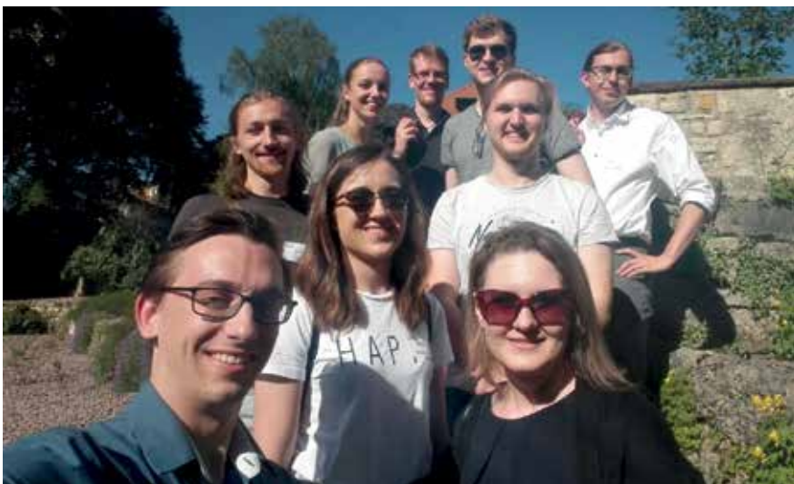
Beim Regionaltreffen stand Networking auf dem Programm. Im botanischen Garten gab's zwischendurch eine Pause.