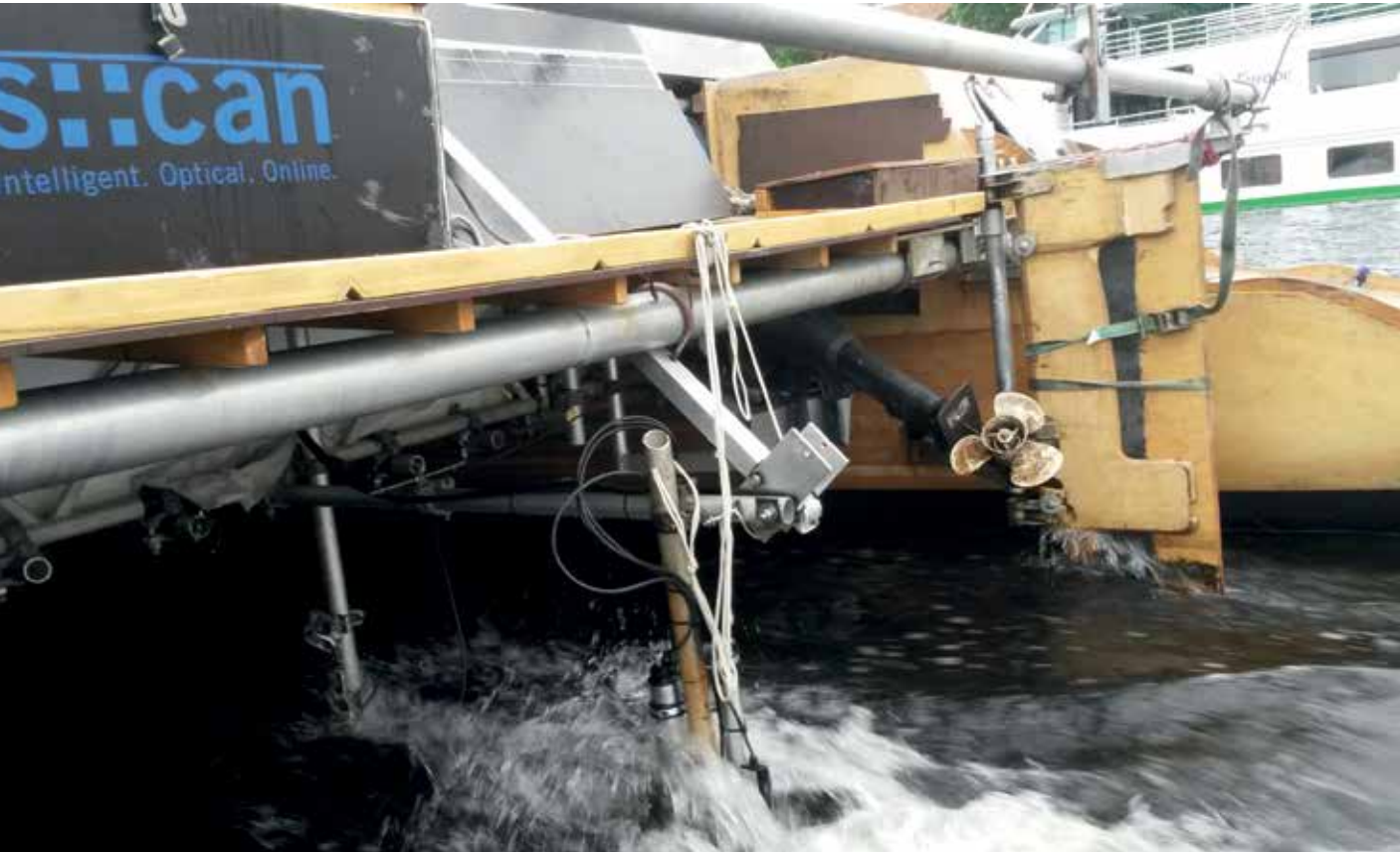
Beitrag für den Umweltschutz: Der Messgeräteträger am Heck der Esperantos, die auf dem Weg ans Schwarze Meer ist.

Bauprojekte gegen Kost und Logis finden konnte. Vier Wochen später begann in einer leerstehenden Scheune im norddeutschen Schöppenstedt der Bau.