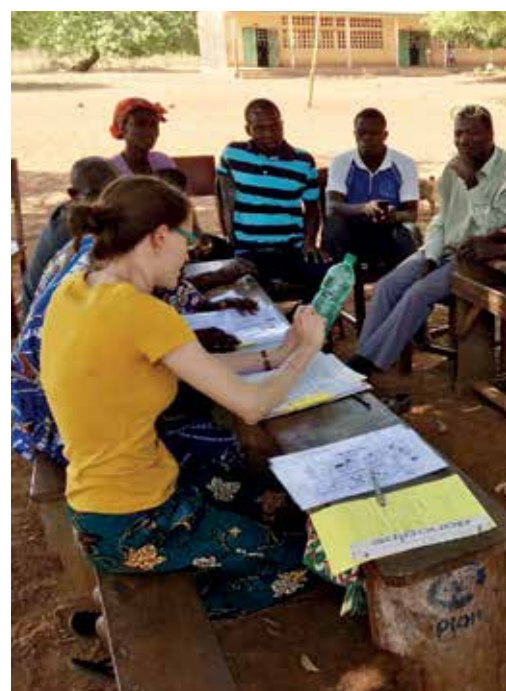
Wissen weitergeben, partnerschaftlich zusammenarbeiten – so lautet die Devise.

Menschenleben verbessern und Menschenleben vorbestimmen: Diesen schmalen Grat zu beachten, ist wesentlicher Teil von ethischem Handeln. Bei der ehrenamtlichen Entwicklungszusammen-